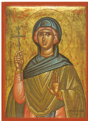
H. Xenia , de moniale